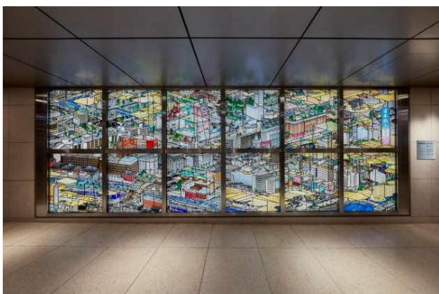
「日本橋南詰盛況乃圖」(2021) 原画・監修／山口 晃氏 東京メトロ銀座線 日本橋駅（東京都）

※本パブリックアートは、一般財団法人日本宝くじ協会の「社会貢献広報事業」の助成を受けて整備されています。