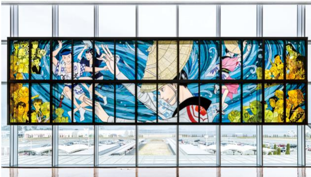
「ZOMEKI -悠久の二拍子-」(2022) 原画・監修／竹宮 恵子氏 徳島阿波おどり空港（徳島県）

※本パブリックアートは、一般財団法人日本宝くじ協会の「社会貢献広報事業」の助成を受けて整備されています。