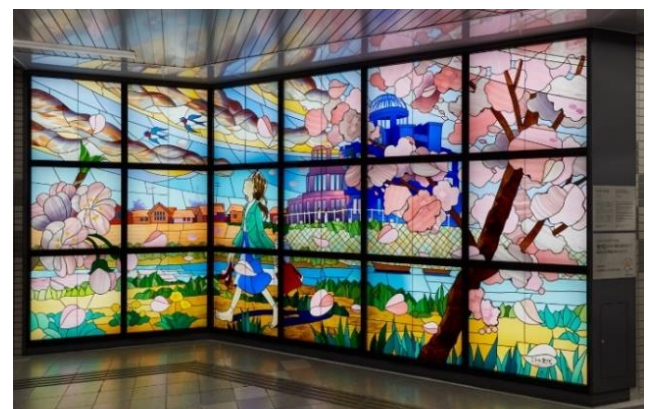
「夕凧の街 桜の国」(2019) 原画・監修／このの 史代氏 アストラムライン本通駅（広島県）

※本パブリックアートは、一般財団法人日本宝くじ協会の「社会貢献広報事業」の助成を受けて整備されています。